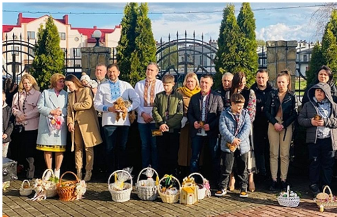
Familien mit Osterkörben auf dem Kirchplatz

Spendenkonto: Kirchengemeinde Trier-Heiligkreuz IBAN DE14 5855 0130 0000 4901 69 - Sparkasse Trier - Stichwort ‚Spende Ukraine‘