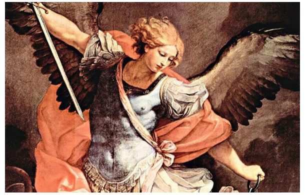
Erzengel Michael von Guido Reni, 1635, Altarbild in der Kirche Santa Maria della Concezione dei Cappuccini in Rom. (Ausschnitt)