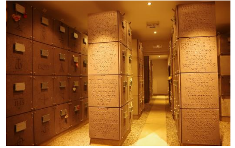
Urnengruft St. Michael