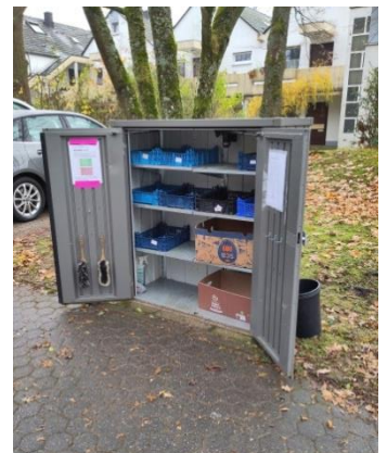
Ein Beispiel in der Nachbarschaft: Der Lebensmittelschrank im Schammatdorf

Spendenkonto: Kirchengemeinde Trier-Heiligkreuz IBAN DE14 5855 0130 0000 4901 69 Stichwort: Spende Lebensmittelschrank