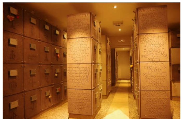
Urnengruft St. Michael, Bild: Reinhold Bonertz, Mariahof